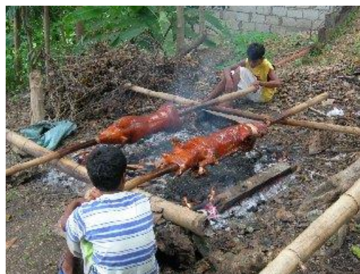
Til venstre: Her vert det bora etter vatn med enkelt utstyr. Kreativiteten er stor! Til høgre: Heilsteikt gris er vanleg festmat for dei "velstående".